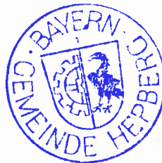
Albin Steiner Erster Bürgermeister